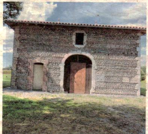
La grange de Camblat pour un projet participatif. e.s.

La grange de Camblat ne bénéficie d'aucune aide financière ni de subvention.